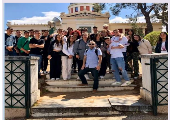
Στο Γεωδυναμικό Ινστιτούτο ως Εκπαιδευτικός και υπεύθυνος προγράμματος σχολικών δραστηριοτήτων